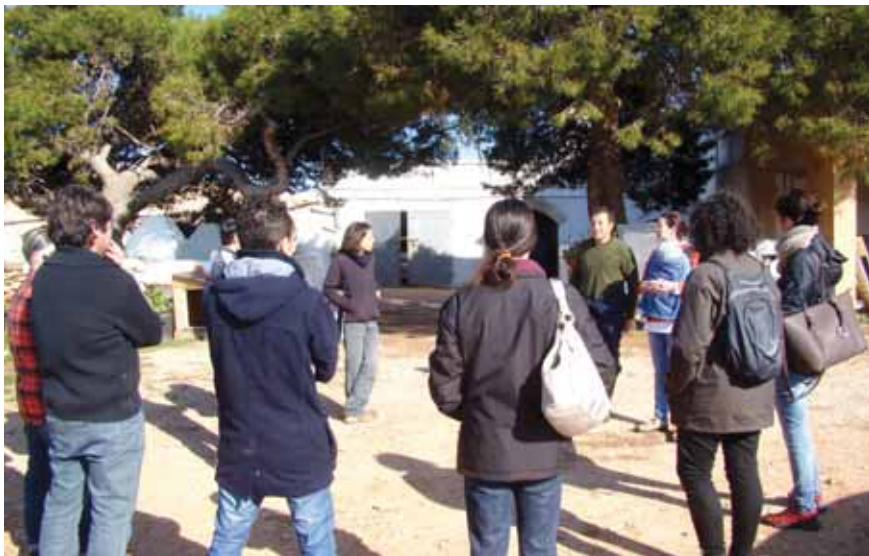
Curs 'Educació crítica per a un nou model alimentari, social i econòmic' per a professorat de secundària realitzat conjuntament amb el CEP Menorca.