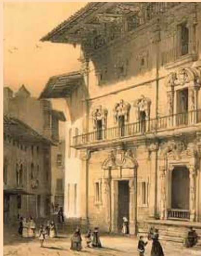
Ajuntament de Palma (1839). J. B. LAURENS, Souvenirs d'un voyage d'art a l'île de Majorque .

El Reglamento antes citado, especificaba en su artículo 2° que “Habrá en